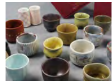
サミットで国内外の報道関係者に配布された「いゝ呑み」

「日本の食卓に豊かな器文化を取り戻す」活動を推進しています。日本の器の魅力を伝えるテーブルコーディネート提案をします。また、今年5月に志摩市賢島で行われたG7伊勢志摩サミットの晩餐会で、各国首脳のおもてなしに使われた食器を展示します。日本のやきもの素晴らしさをじっくりご覧ください。