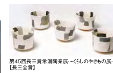
第45回長三賞常滑陶業展~くらしのやきもの展~ [長三賞]

長三賞常滑陶業展は、千年の「やきもの」の歴史と伝統を誇る常滑市が、毎年開催している全国規模の公募展です。審査の結果、選ばれた最高賞の長三賞作品をはじめ、ものづくりの伝統を生かしながらも、現代の暮らしに文化的刺激を与える、美しさ・確かさ・楽しさ・驚き等、心にひびく作品を展示します。