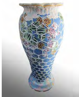
盛上綱文葡萄花瓶 明治時代後期 錦光山