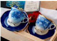
各国首脳への三重県産品「手描きコーヒーカップ&ソーサー」