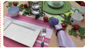
※有田焼カフェ茶碗シリーズ(昨年出品の商品)