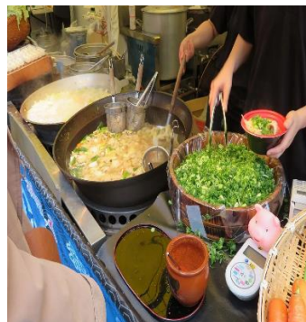
九条ねぎ鍋(京都府)