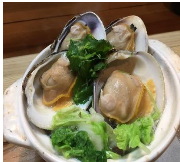
白ハマグリ鍋(千葉県)