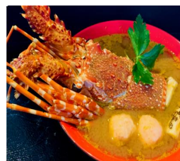
伊勢海老の濃厚みそ鍋(三重県)