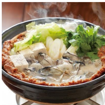
かき土手鍋（広島県）