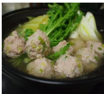
名古屋コーチンつみれ鍋(愛知県)