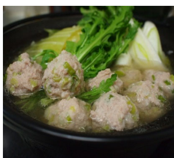
名古屋コーチンつみれ鍋(愛知県)