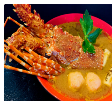
伊勢海老の濃厚みそ鍋(三重県)