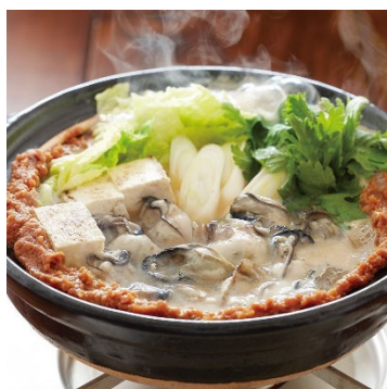
かき土手鍋（広島県）