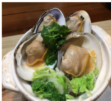
白ハマグリ鍋(千葉県)