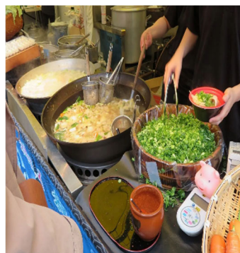
九条ねぎ鍋(京都府)